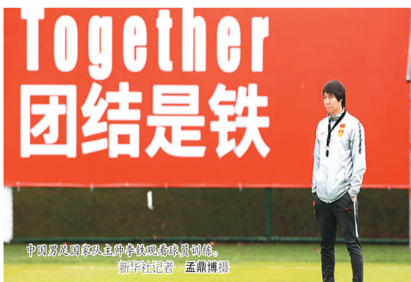
中国男足国家队主帅李铁观看球员训练。