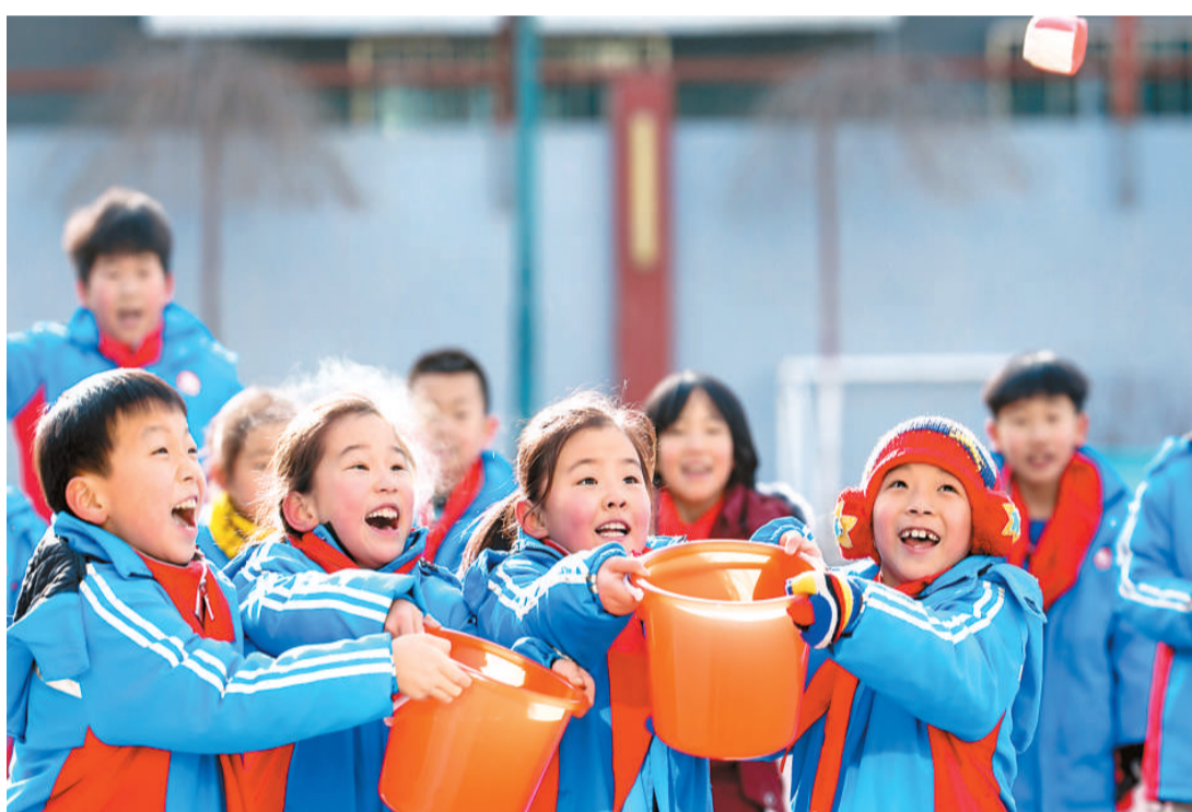
内蒙古呼和浩特市玉泉区通顺路小学学生在玩沙包抛接游戏。

所有过往，皆为序章。 2020年的新冠肺炎疫情，极大地改变了世界体育的面貌，也让体育人在艰难之中怀揣希望，寻找火光所在。 新的一年即将到来。在变与不变中，那些愿望会实现吗？不妨让我们展开畅想。