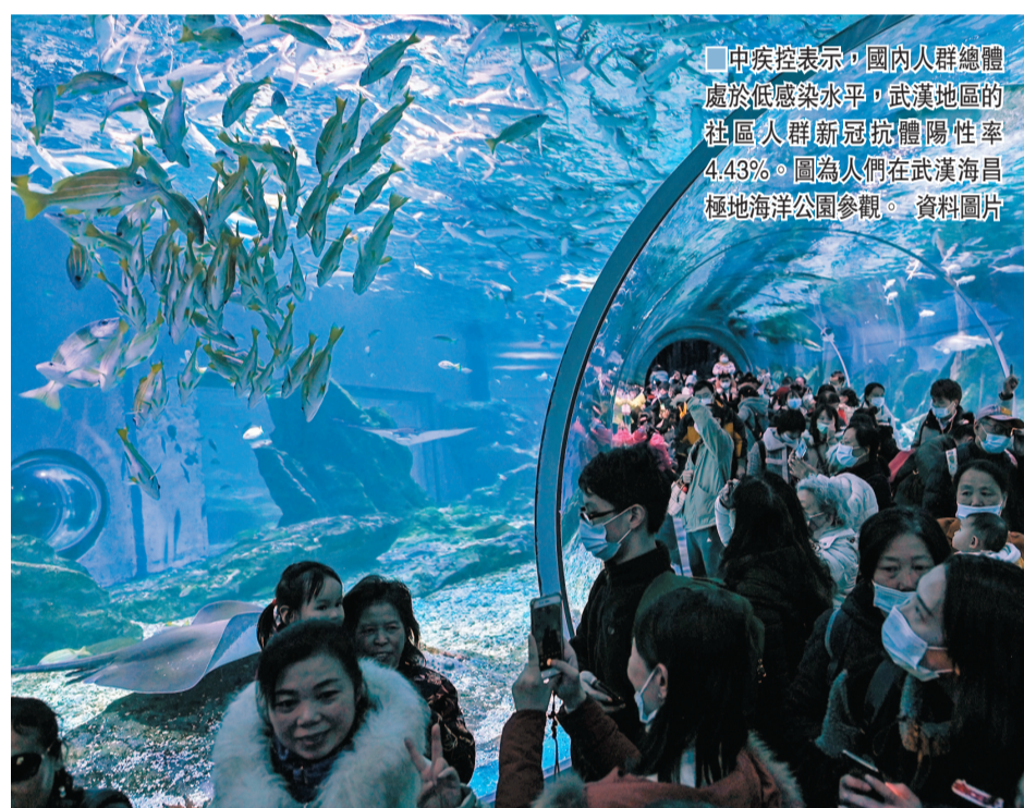
中疾控表示，國內人群總體處於低感染水平，武漢地區的社區人群新冠抗體陽性率4.43%。圖為人們在武漢海昌極地海洋公園參觀。

血清流行病學調查是採用血清學方法和技術開展的流行病學調查，通過對人群血清中特异性抗原或抗體的分佈規律及其影響因素的分析研究，闡明傳染性疾病的發生與流行的規律，評價預防接種的效果等。此次新冠肺炎血清流行病學調查是在中國遏制第一波新冠肺炎疫情的一個月後，在代表性地區開展的橫斷面調查，通過在人群中進行有代表性的抽樣，採集血清樣本進行抗體檢測，了解新冠病毒在人群中的感染水平。 ■整理：香港文匯報記者 王珏