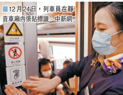
12月24日，列車員在靜音車廂內張貼標識。

至於疫情的限流措施，國鐵集團表示，將嚴控列車超載率，預留發熱旅客隔離座位，並及時下車移交，全面貫徹冬春季常態化疫情防控要求。