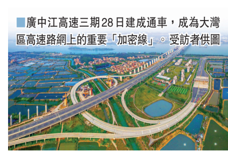
廣中江高速三期28日建成通車，成為大灣區高速路網上的重要「加密線」。

廣佛肇高速也是大灣區重點交通建設項目，佛山段二期與廣州段 (即廣佛段二期) 同時建成通車。從廣州白雲區到肇慶只需30分鐘，並通過華