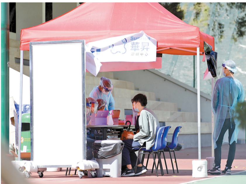
政府於觀塘秀雅道遊樂場安排辦華大基因增設流動採樣站，為聯合醫院工作人員、訪客及病人提供免費檢測服務。

醫管局公布，本港昨日共有4名確診者不治，至今共有137人於公立醫院離世。當中，包括聯合醫院一名74歲女病人，她有末期病患；以及明愛醫院一名73歲男病人、仁濟醫院一名85歲女病人、屯門醫院一名70歲男病人，他們均有長期病患。另外，港大感染及傳染病中心總監何栢良表示，