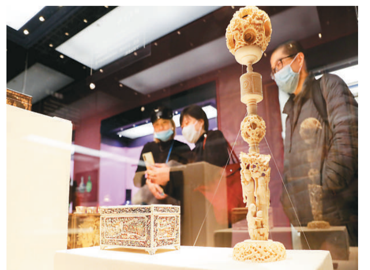
12月28日，“大海就在那里：中国古代航海文物大展”位于上海临港新城的中国航海博物馆开幕，从多角度展现中华航海文明。图为参观者在观看一组雕刻工艺品。