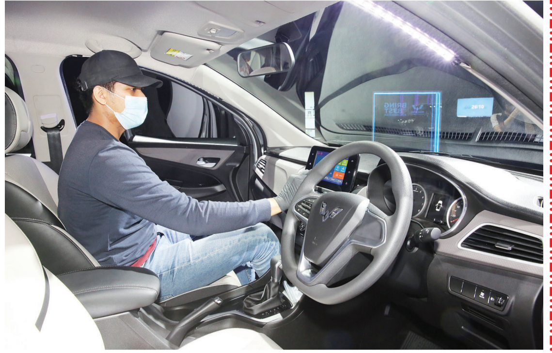
车内舱充满智能系统

【本报讯】五菱汽车通过其旗舰MPV多功能汽车,在本国的汽车界得到赞赏。Cortez CT在2020 Grid Oto活动中获得两项大奖。