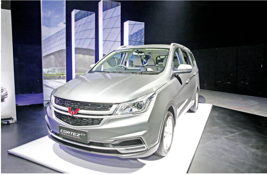
五菱cortez MPV 车外形