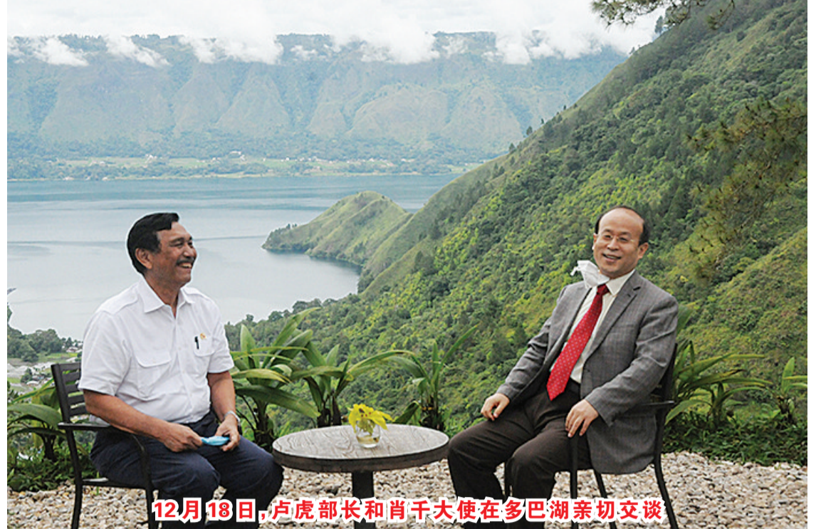
12月18日,卢虎部长和肖千大使在多巴湖亲切交谈