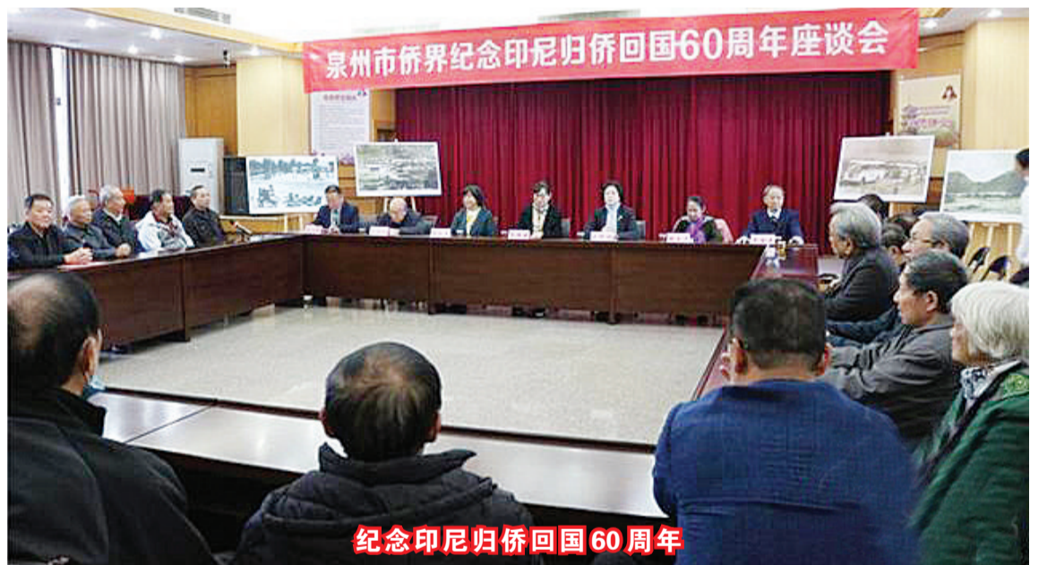
纪念印尼归侨回国60周年

60年,人生一甲子,赤子情最真。座谈会结束后,主办方组织大家前往洛江双阳厝民俗文化园参观考察。