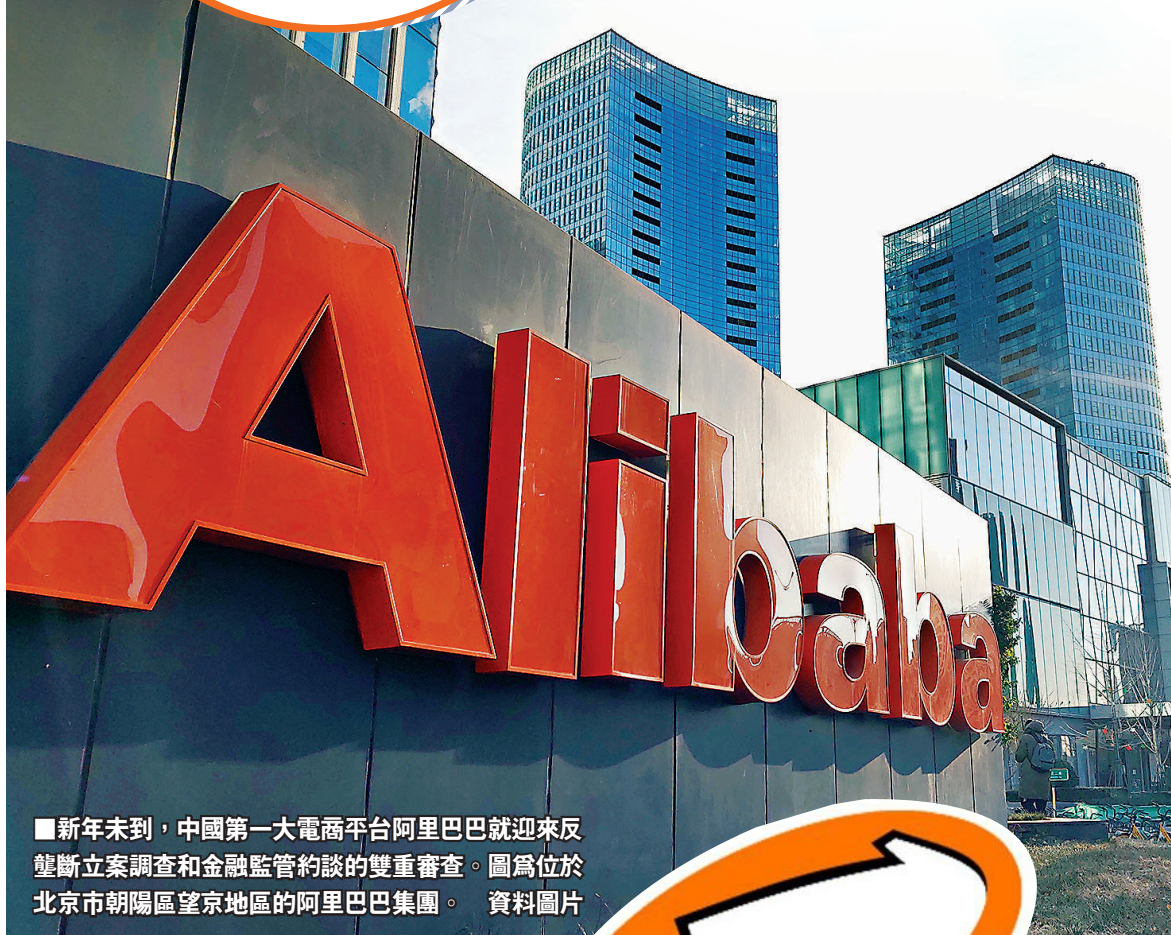
■新年未到，中國第一大電商平台阿里巴巴就迎來反壟斷立案調查和金融監管約談的雙重審查。圖為位於北京市朝陽區望京地區的阿里巴巴集團。資料圖片

有序，例如用戶信息的保護和隔離。 健全傳統行業競爭審查機制 此外，傳統行業的反壟斷也有望順勢加快。「十四五」規劃建議明確表示，要打破行業壟斷和地方保護，破除妨礙生產要素市場化配置和商品服務流通的體制機制障礙，推進能源、鐵路、電信、公用事業等行業競爭性環節市場化改革，健全公平競爭審查機制。 專家認為，政府釋放出鼓勵能源、鐵路等帶有自然壟斷、行政壟斷基因的行业適度競爭、主體多元化的信號，這些領域的反壟斷涉及改革深水區，是暢通國內經濟循環的關鍵，亟待推進。