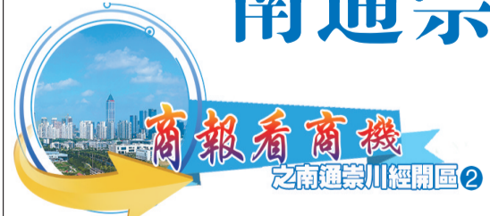
商報看商機 之南通崇川經開區

南通崇川經濟開發區位於南通市主城崇川區內，是長三角重要的創新資源集聚地，目前以大數據、雲計算、智能芯片、智慧建築、物聯網等為代表的軟件和信息技術服務業已初具規模。