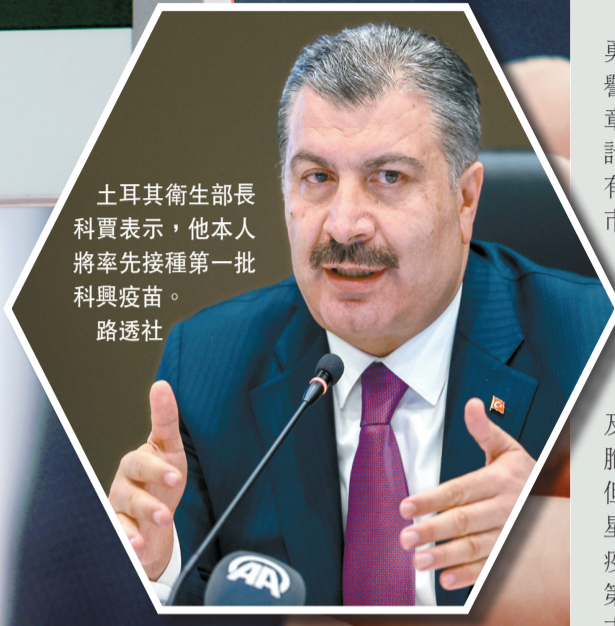
土耳其衛生部長科賈表示，他本人將率先接種第一批科興疫苗。

【香港商報訊】土耳其衛生部長科賈當地時間周四表示，根據土耳其752名自願接種中國疫苗的志願者的數據分析顯示，中國科興疫苗有效性達91.25%，無嚴重副作用，可以確定其在土耳其人身上是安全有效且可信的。科賈又稱，從中國訂購的第一批疫苗計劃於周日從中國啟運，預計下周一抵達土耳其。