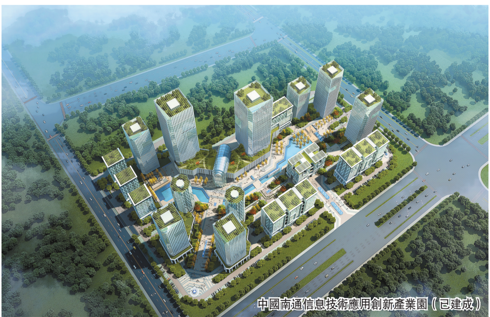
中國南通信息技術應用創新產業園 (已建成)