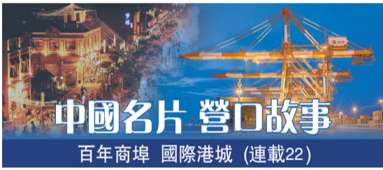
中國名片 營口故事 百年埠 國際港城 (連載22)

遼寧自貿區營口片區依託國家級營口高新區開發建設，2017年4月掛牌。同年12月營口綜合保稅區獲批建設，2018年12月通過國家驗收，2019年4月投入運營，「三區」實際控制面積39.16平方公里。「建設區域性國際物流中心，打造高端裝備製造基地，高新技術產業基地，構建國際海鐵聯運大通道的重要樞紐。」這是國家賦予營口片區的發展定位。