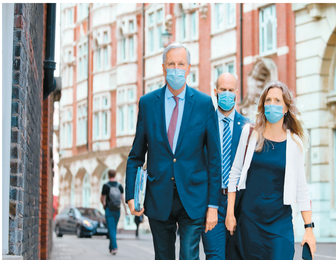
九月十日，负责英国“脱欧”事务的欧盟首席谈判代表巴尼耶（左）走在伦敦街头。

按照英国“脱欧”协议，英国脱欧过渡期在今年年底结束。距离英国“脱欧”过渡期最后期限仅剩一周之际，英国与欧盟最终就英国“脱欧”后的贸易问题达成协议。