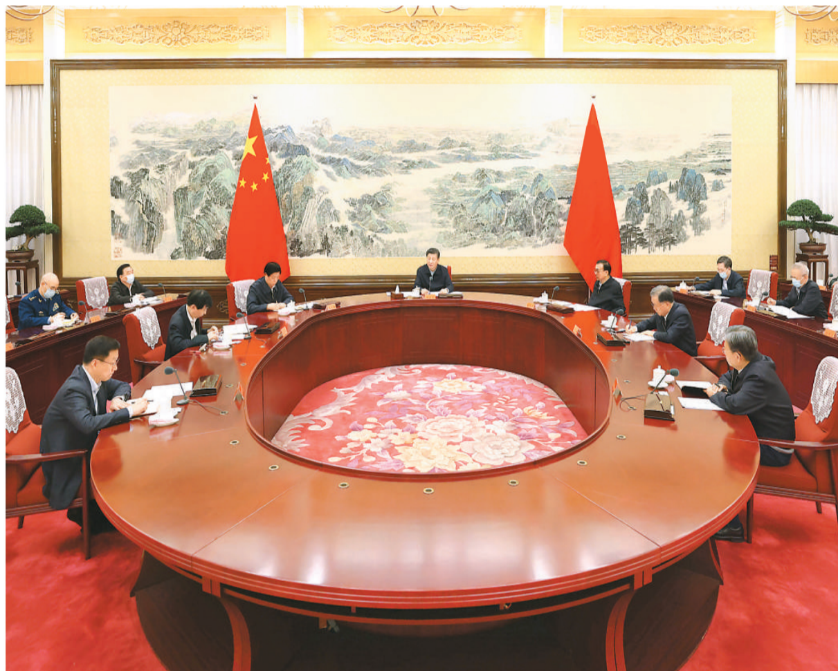
12月24日至25日,中共中央政治局召开民主生活会,中共中央总书记习近平主持会议并发表重要讲话。

新华社北京12月25日电 中共中央政治局于12月24日至25日召开民主生活会,主题是认真学习习近平新时代中国特色社会主义思想,加强政治建设,提高政治能力,坚守人民情怀,夺取全面建成小康社会、实现第一个百年奋斗目标的伟大胜利,开启全面建设社会主义现代化国家新征程。中央政治局的同志联系中央政治局工作,联系个人思想和工作实际,联系带头严格执行中央政治局关于加强和维护党中央集中统一领导的若干规定,联系带头贯彻落实习近平总书记重要指示批示和党中央决策部署的实际,联系带头严格执行中央八项规定及其实施细则和解决形式主义突出问题、为基层减负的实际,进行自我检查、党性分析,开展批评和自我批评。