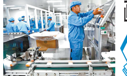
■投入使用後將使「克爾來福」的年生產能力提高到6億劑以上。

另外，香港22日新增十宗新冠肺炎輸入個案，當中兩人來自英國，其中一人抵港已12天，在酒店檢疫期間對新冠病毒呈陽性反應。由於英國發現新冠病毒變種，傳播力大增七成，香港特區政府隨即禁止過去14天曾在英國逗留超過兩小時的人士入境。不過醫學會傳染病顧問委員會聯席主席曾祈殷認為，香港防變種病毒輸入的措施仍有漏洞，因為英國早前已出現變種病毒，部分確診者將病毒帶到歐洲，香港只對英國「封關」，無法阻截變種病毒經由歐洲等旅客帶入香港。