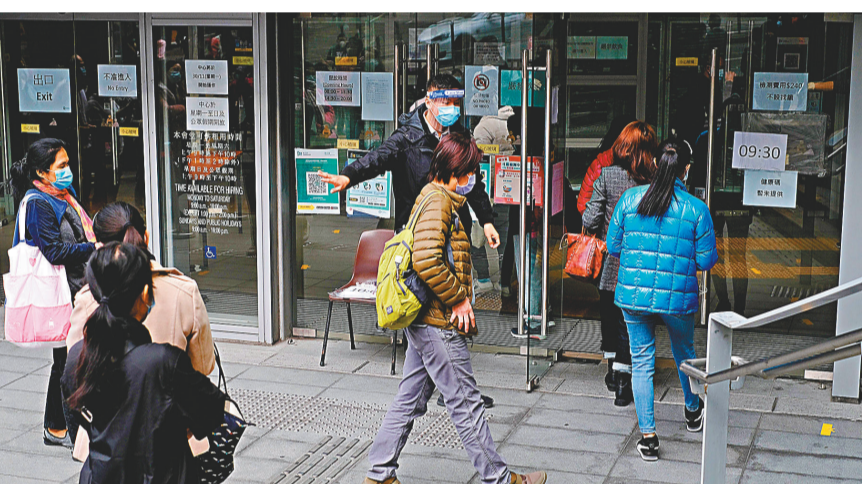
▶多位專家倡議盡快推行強制檢測等相應防疫措施。圖為政府為油蔴地居民提供免費檢測。

香港醫學會會長余達明醫生22日接受香港文匯報訪問時表示，現時社區有太多不明源頭的個案，不少確診者沒有病徵，更有醫生為病人治療時確診，情況十分嚴峻，如再持續下去，疫情沒完沒了，香港的醫療系統勢必被拖垮，後果將不堪設想。