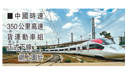
■中國時速350公里高速貨運動車組正式下線。網上圖片

香港文匯報訊 據中新社報道，經過3年多努力，由中車唐山公司牽頭，聯合國內優勢部門開展突破的世界首列時速350公里高速貨運動車組，在河北唐山下線。 該動車組每節車廂側面都有一對2.9米寬、全球最大開度的裝載門，這是高速貨運動車組區別於普通客運動車組最顯著的外觀特徵。 中車唐山公司產品研發中心高級工程師，高速