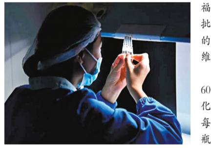
■工作人員會穿上全密封防護服後，進入密閉車間進行扶正操作。網上圖片

曾祈殷表示，政府不能只關注英國的情況，因為早前已有英國的變種病毒株在歐洲其他國家出現，「譬如荷蘭、比利時、法國、丹麥等。特區政府需時刻更新入境條例，有否需要限制更多歐洲國家，尤其來自以上國家航機入境。」他續指，英國設有機制不定期隨機抽取病毒樣本檢驗，推斷今年9月時當地已發現病毒有基因突變，因此變種病毒或於9月至11月時已傳入鄰近歐洲國家。