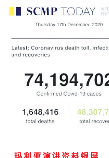
玛丽雅演讲资料银屏