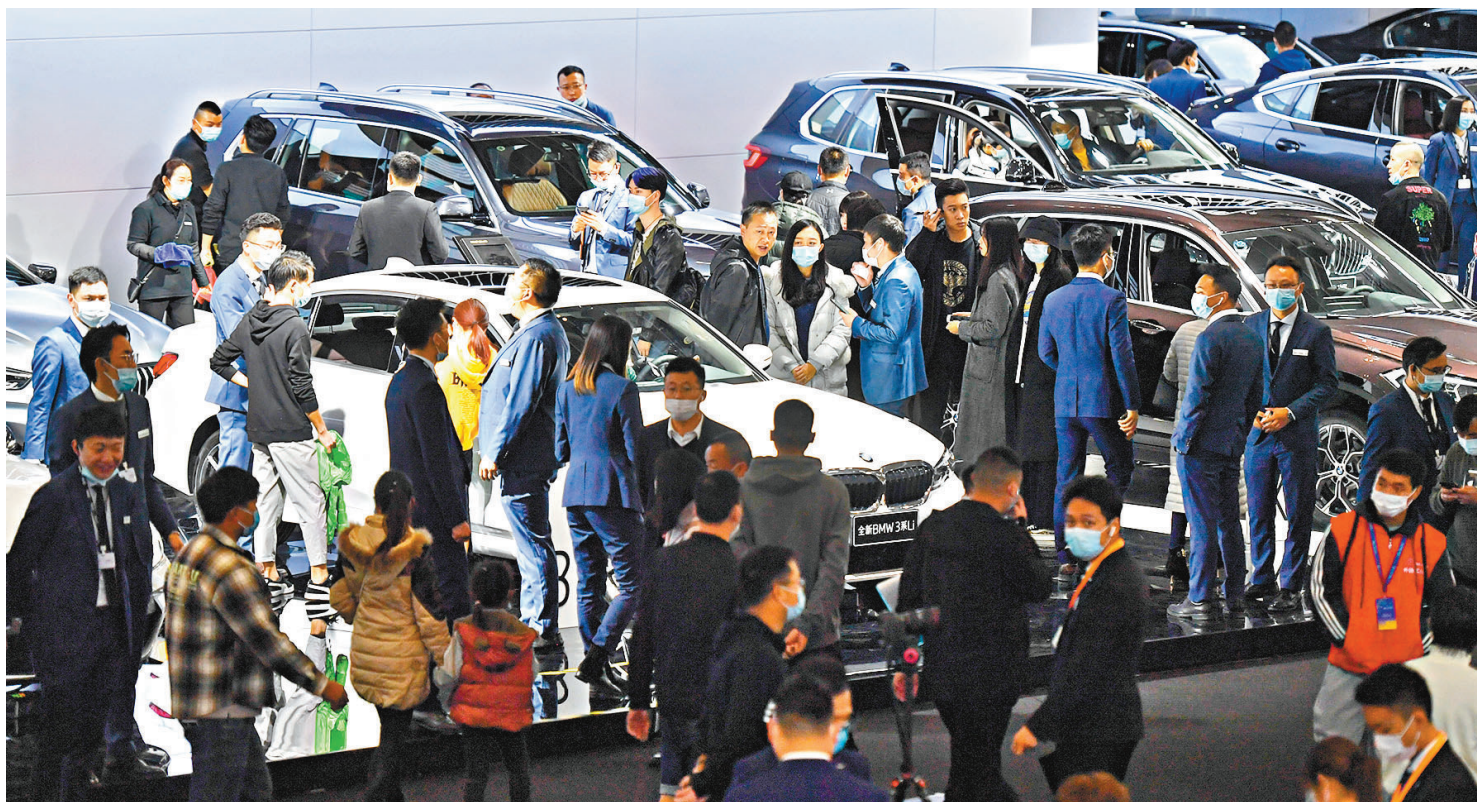
專家建議，適度調整娛樂、服務、奢侈性消費等行業發展的限制性政策。圖為民眾早前在2020(第十七屆)中國西南(昆明)國際汽車博覽會了解心儀車型。