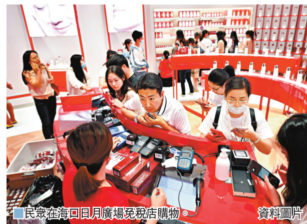
民眾在海口日月廣場免稅店購物。

劉元春舉例說，取消行政性限制消費可能還包括一些政府購買和政府消費。比如，醫療消費中，通過放大醫保的限制，讓更多人享受到優質的醫療服務。中國人民大學重慶金融研究院執行院長王文則預計「八項規定」將鬆動。