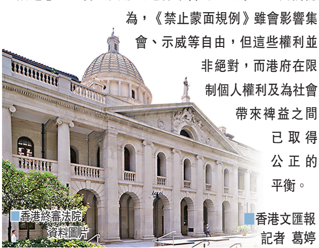
香港文匯報記者 葛婷

香港特區終審法院21日一致裁定《禁止蒙面規例》司法覆核,政府方終極勝訴,而25名反對派提出的上訴則被駁回。判詞指,港府去年引用《緊急情況規例條例》(緊急法)以「危害公安」為由訂立的《禁止蒙面規例》並無違憲,即合法與非法遊行集會均不可蒙面。判詞認為,《禁止蒙面規例》雖會影響集會、示威等自由,但這些權利並非絕對,而港府在限制個人權利及為社會帶來裨益之間已取得公正的平衡。