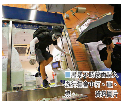
黑暴不時蒙面混入遊行集會中打、砸、燒。資料圖片