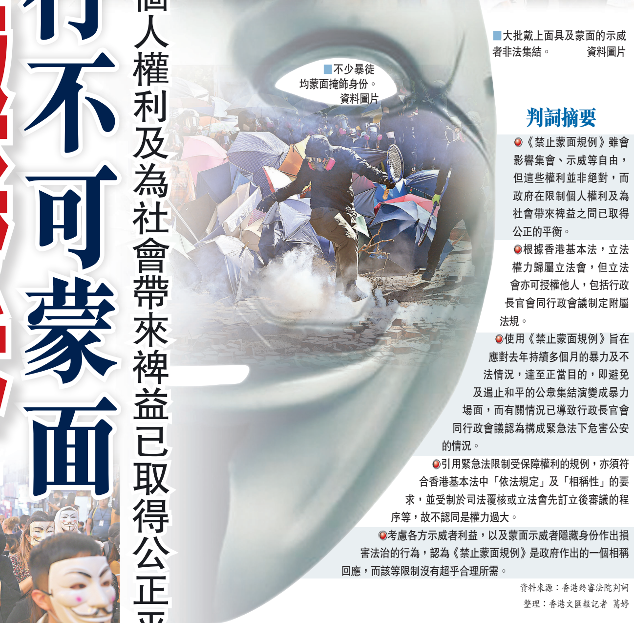
示威者及支持者佩戴蒙面物品為其參與暴力行為起了「壯膽」作用。資料圖片