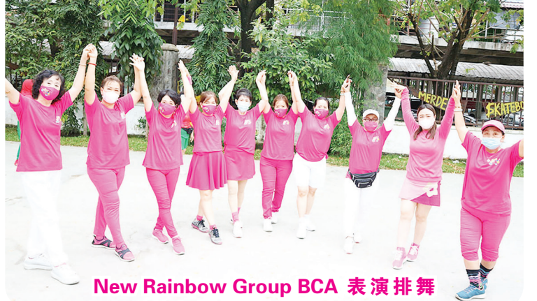
New Rainbow Group BCA 表演排舞

【棉兰讯】普世欢腾的圣诞节转眼间降临大地,不过今年由于新冠病毒 Covid-19 正在肆虐全球各国,疫情严峻,因此庆祝圣诞节只好遵守政府所规定防疫措施,改以简单的方式进行,限制人数,避免群集,保持社交距离并须戴口罩。 棉兰独立广场“拉筋健身晨运队”Senam