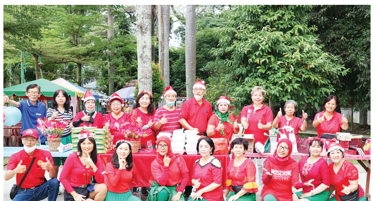
全体 STU 晨运队合照