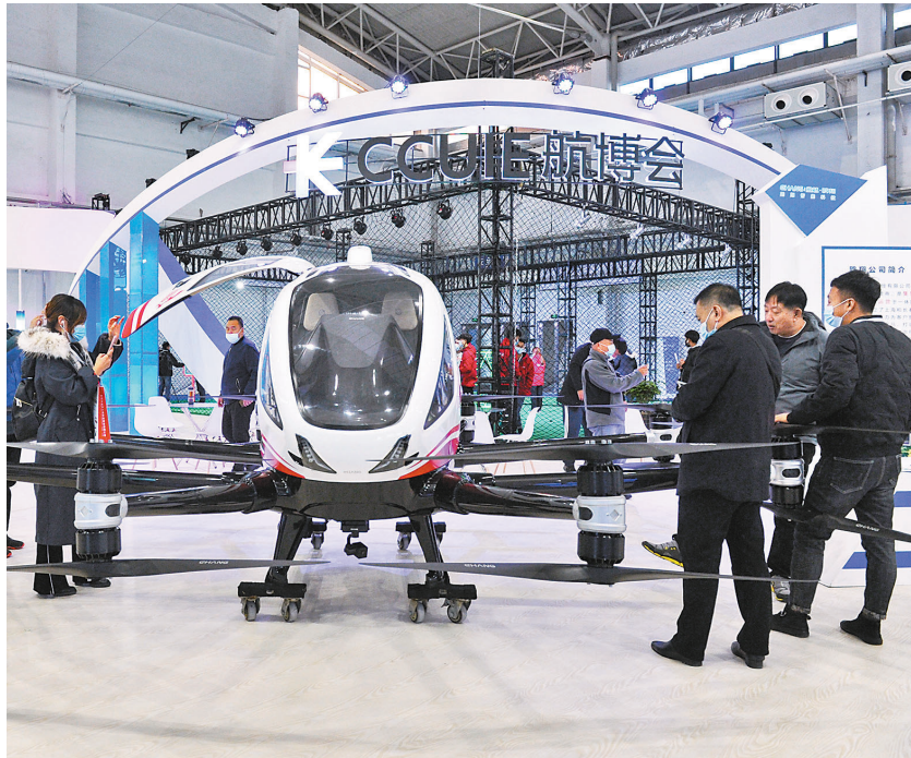
有專家表示，明年改革工作重點落在深化國企改革和促進市場公平競爭上。圖為10月舉行的長春 (國際) 無人機產業博覽會。