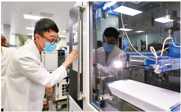
會議特別注重創科發展方面，香港可利用其優勢，抓住發展機遇。圖為港工程師在納米研發院工作。

清泉認為，香港應用原創性、顛覆性、突破性思維、理性質疑精神等有利研發優勢，建設成為國際科創中心，特別是在原創性和基礎學科兩方面。他提到香港有名牌的大學，大學實驗室產生科學成果，從科學變為技術就需要應用轉化與研發，相較下深圳東莞都有大型研發中心，故加強灣區合作非常重要。