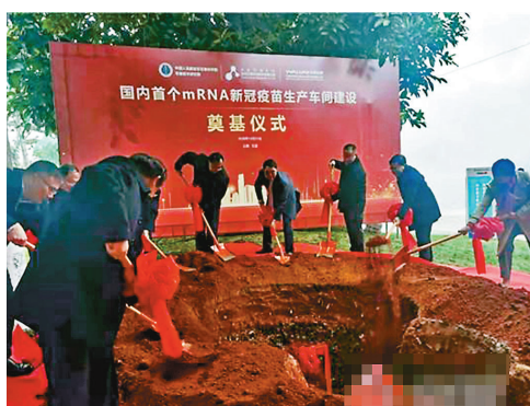
中國首個mRNA新冠疫苗生產車間建設奠基儀式21日在雲南省玉溪市疫苗產業園舉行。小圖為工作人員在演示新型冠狀病毒mRNA疫苗實驗過程。

中國新冠病毒疫苗有5條技術路線，包括滅活疫苗、腺病毒載體疫苗、流感病毒載體疫苗、重組蛋白疫苗、核酸疫苗 (mRNA疫苗、DNA疫苗)。陶黎納指出，其中只有mRNA疫苗是一個新技術，相對其他技術的疫苗來說，其安全性風險要大些，但也不至於有預想不到的不良反應。