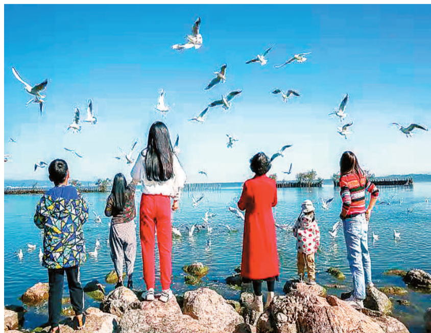
游客在滇池南岸观赏野鸟。

据中国濒危动物红皮书记载，彩鹮曾连续多年未在中国观测到，一度被认为在中国绝迹，沼泽等栖息地的减少和环境污染是其濒临绝迹的主要原因。近年来，由于各级党委政府不断加大生态治理，环境不断改善，中国境内的沼泽湿地、湖滨生态等逐步恢复，彩鹮逐渐有了观测记录。近几年在昆明晋宁发现彩鹮、白眉鸭和多种类的野鸭野鸟群体，表明一批珍稀濒危动物已经找到了它们心仪的归属地。