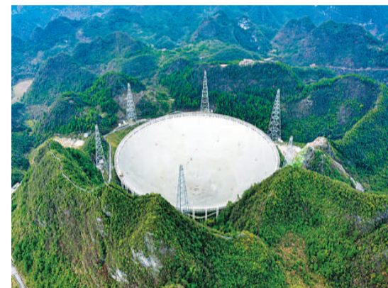
11月11日,被誉为“中国天眼”的500米口径球面射电望远镜通过国家验收正式开放运行。