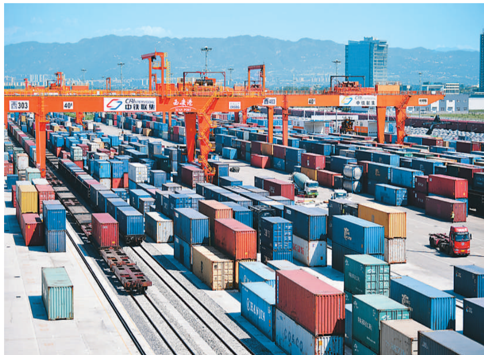
“长安号”中欧班列在西安新筑车站内装卸集装箱。

外媒对此广泛关注并作出积极预测:中国经济平稳复苏为2020年动荡中的全球经济增添一抹亮色,中国经济持续增长有望为2021年全球经济复苏提供强劲驱动力。