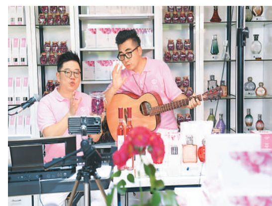
在浙江湖州吴兴区埭溪镇四季玫瑰庄园,一个直播团队在售卖玫瑰主题的化妆品。