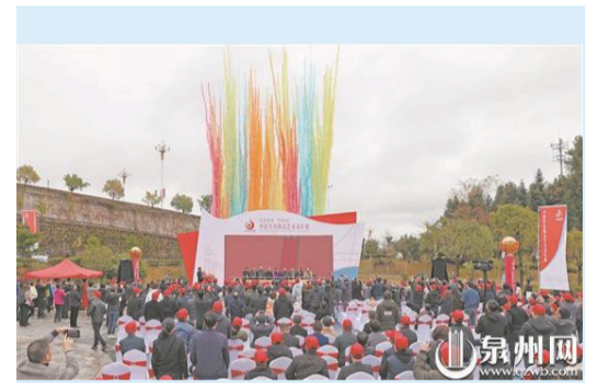
▲首屆德化“中國白”中國傳統陶瓷藝術雙年展開幕

勇攀藝術高峰，創作更多獨具藝術價值的精品力作，推動“中國白”再次出發遠行，讓中國德化白瓷在新時代演繹新經典、再現新榮光！（陳小芬 莊麗祥 林婉清 李宏圖）