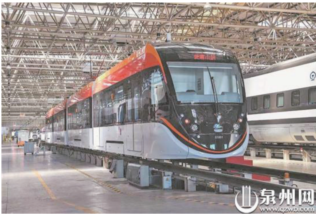
記者獲悉，泉州中車唐車公司為福建省南平市武夷新區旅遊觀光軌道交通項目研

的首列100%低地板現代有軌電車日前下線，這是繼福州1、2號線，廈門1、2號線等B型鋁合金地鐵列車製造後的又一新型電車問世。