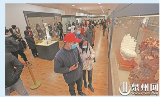
▲雙年展吸引眾多參觀者前來