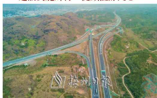
華陸高速和興華高速在安流鎮交會。

2018年，安流鎮11個省定貧困村先行打造新農村示範村建設。幹淨整潔的村道、寬闊的村文化廣場、嶄新的衛生站、現代化的污水處理濕地……兩年多來，一個個美麗鄉村舊貌換新顏，老百姓切身感受到貧困村的蛻變，村民的獲得感、幸福感全面提升。