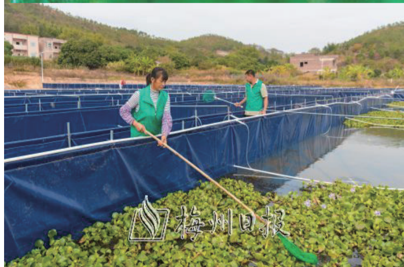
安流鎮吉程村引進梅州隆森生態農業科技有限公司發展淨水養殖小龍蝦項目。