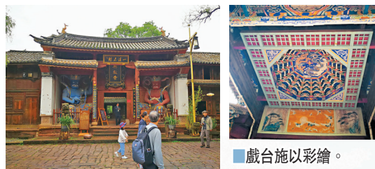
■600餘年歷史的興教寺。

與興教寺東西相對的古戲台，是寺登街的標誌性建築，其風格獨具匠心，結構精巧壯觀，由三層十四個飛檐角歇山式建築組成，均施以彩繪，酷似展翅欲飛的鳳凰，整個建築集戲閣、戲台、商舖為一體。在馬幫行走年代，戲台上日復一日上演的古戲，與興教寺的晨鐘暮鼓遙相呼應，既是當地白族人民敬奉觀音的地方，也是趕馬人與馬頭驅散旅途疲勞、放鬆身心之所在，更是南來北往的馬幫與商旅心中的「天堂」。