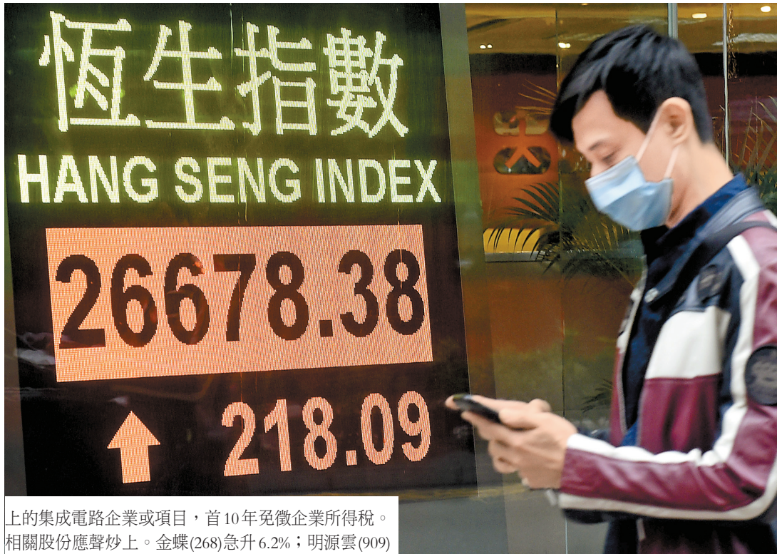
▲昨日港股一路向上，以全日最高位收市。