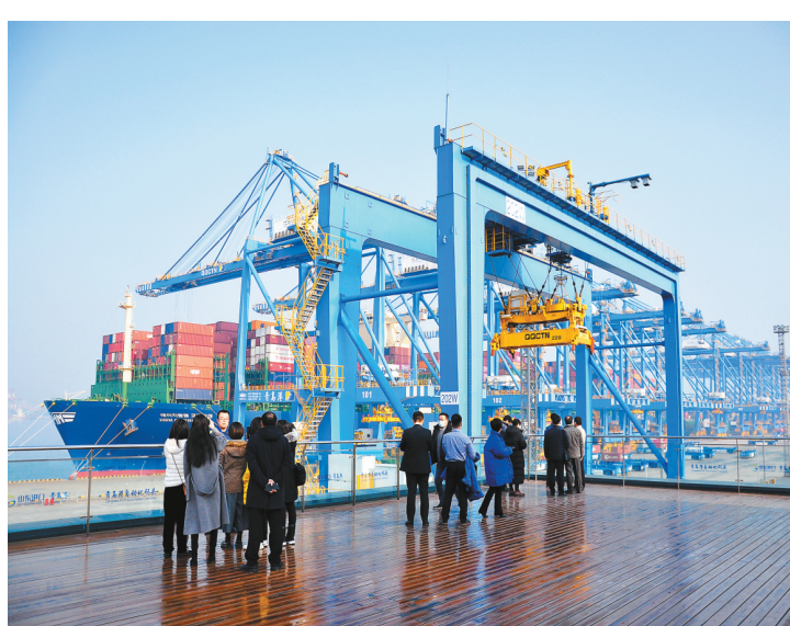
粵港澳媒體採訪團在青島港全自動化集裝箱碼頭採訪

不到一年間，膠東經濟圈一體化全面起勢，在交通便利性、產業協同發展、深化開放合作、環境聯合整治等方面都取得顯著成效。下一步，膠東五市將繼續以開放創新引領高質量發展，抓住全球產業鏈重構重大機遇，構建發展主體多元、產業生態迭代、營商環境優化、城市服務文化生態支撐保障有力的活力生態體系。