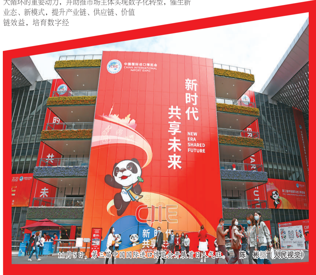
11月3日，第三届中国国际进口博览会开展首日人气旺。

商务部公布的最新数据显示，全国实际使用外资连续8个月实现同比增长。12月16日，据国际在线报道，外交部发言人汪文斌16日表示，外资持续涌入中国体现了各国对中国经济发展前景的信心，也展现了中国积极构建新发展格局，不断扩大对外开放的成效。汪文斌介绍，今年以来，中国全面实施外商投资法及其实施条例，自贸试验区的负面清单由2013年的190项减少到目前的30项，稳步推动金融市场准入，出台了海南自由贸易港建设的总体方案，这不仅为中国经济发展开辟了广阔空间，也为世界经济复苏注入了强劲动力。