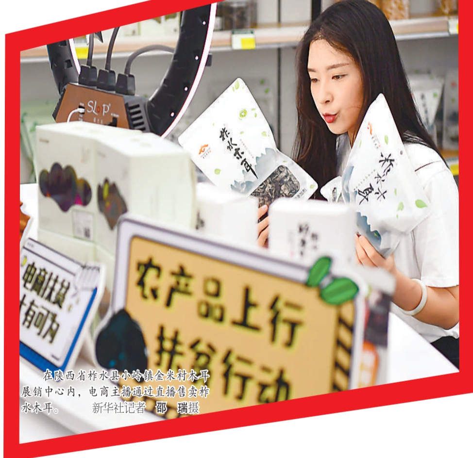
在陕西省柞水县小岭镇金米村农事展销中心内，电商主播通过直播售卖柞水木耳。