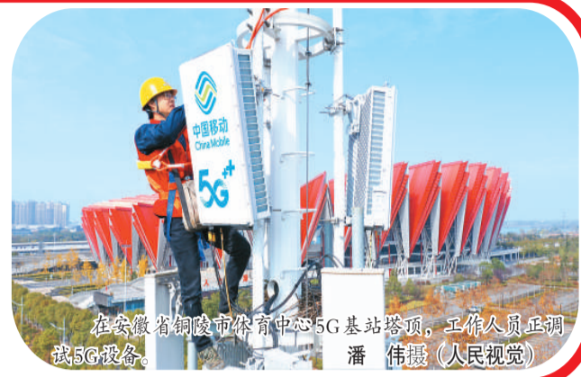
在安徽省铜陵市体育中心5G基站塔顶，工作人员正调试5G设备。

正增长的主要经济体。中国是如何实现经济高质量发展的？经济高质量发展带来了哪些民生福祉？这些成为网友最近热议的话题。