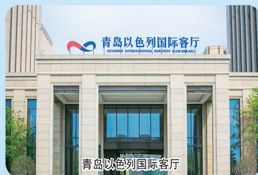
青岛以色列国际客厅