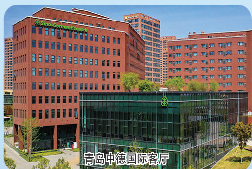
青岛中德国际客厅