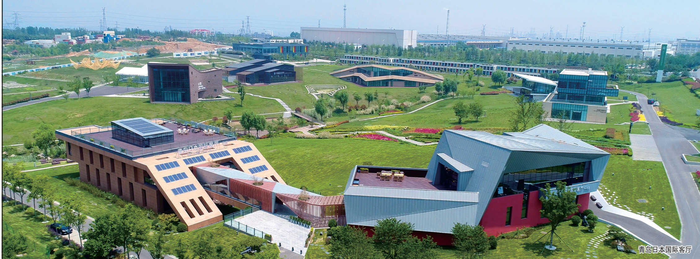
青岛日本国际客厅