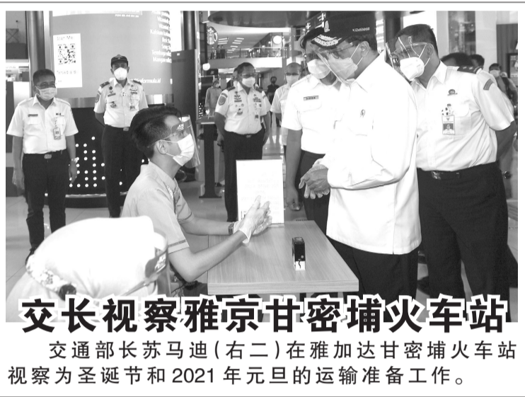
交长视察雅京甘密浦火车站 交通部长苏马迪(右二)在雅加达甘密浦火车站视察为圣诞节和2021年元旦的运输准备工作。