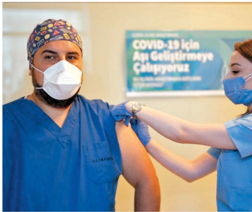
土耳其外長恰武什奧盧14日表示，土方認為中方的疫苗安全有效，已宣布將從中國緊急採購。圖為10月9日，伊斯坦布爾的醫生試種中國新冠疫苗。

香港文匯報訊 綜合路透社、法新社報道，巴西聖羅州長多里亞10日表示，該州布坦坦研究所9日已開始生產中國科興生物公司研發的新冠疫苗「克爾來福」，計劃每天完成最多100萬劑灌裝生產，為下月25日開始的注射計劃做準備。他指出，該款疫苗售價遠低於歐美，已有11個州有意購買。同時，阿根廷、秘魯等多個拉美國家亦有意從巴西購買中國疫苗。巴西總統博索納羅將多里亞視為下屆大選主要競爭對手，因此在中國疫苗議題上大唱反調，被批評為公衛問題政治化、無視國民需求。由於各界施壓，博索納羅政府終於在12日公布疫苗注射計劃，但並未將「克爾來福」列入，且何時注射、如何保證疫苗供應等重要問題均含糊不清，引起專家和公眾強烈不滿。