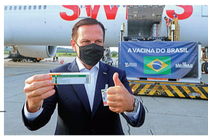
巴西聖羅州長多里亞3日在機場迎接中國疫苗。