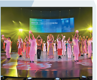
中國—東盟文化藝術周閉幕

為期一周的首屆中國—東盟文化藝術周，閉幕演出14日晚在廣西南寧市舉行，晚會分為四個篇章，以展示中國粵劇、泰國孔劇等中外戲劇歌舞藝術，推動中國與東盟國家文化藝術交流。首屆活動內容涵蓋開幕演出、戲劇展演、電影展映、藝術教育、舞蹈匯演、精品展演等近百場活動。圖為閉幕演出現場。