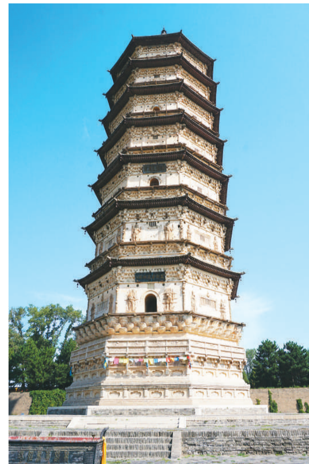
呼和浩特万部华严经塔外观