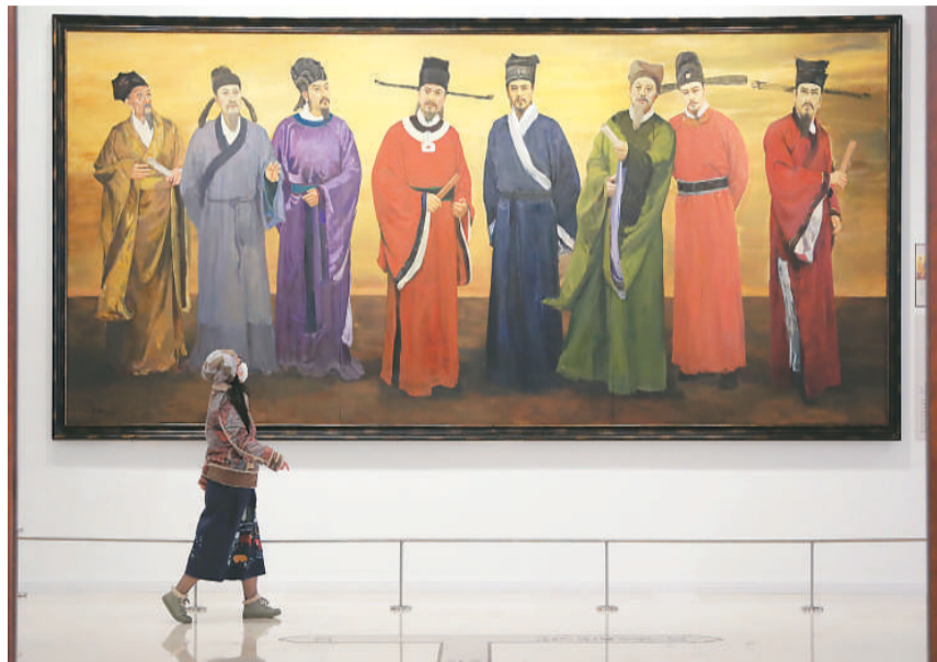
“山高水长——唐宋八大家主题文物展”现场

12月2日，“山高水长——唐宋八大家主题文物展”在辽宁省博物馆开幕。作为本年度最值得期待的展览之一，“唐宋八大家主题文物展”吸引着来自各地的观众走进辽博，通过文物感受八大家绵延千年的文脉和雄唐雅宋的时代风采。