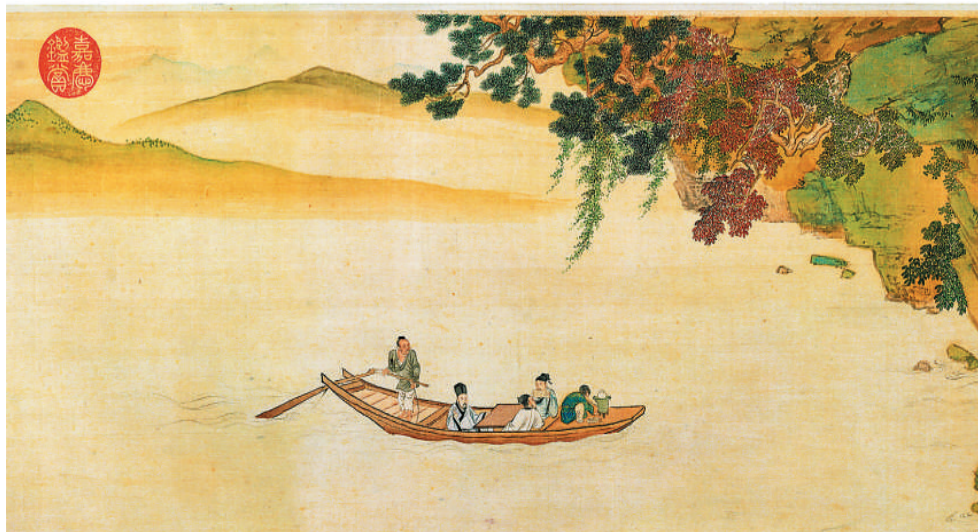
左图：《明仇英赤壁图卷》（局部），右图：《北宋欧阳修行书谱图序稿并诗卷》（局部）