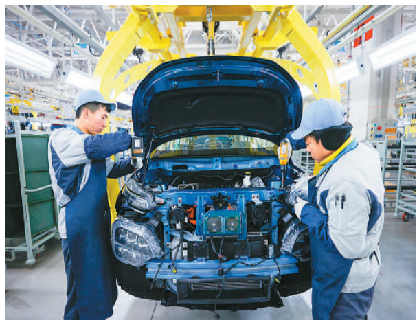
山西运城大运集团新能源汽车项目全部建成达产后,可形成年产2万辆纯电动商用车和10万辆纯电动乘用车的生产能力。图为12月14日,工作人员在总装车间作业。

累计看,1-11月,汽车产销分别完成2237.2万辆和2247.0万辆,同比分别下降3%和2.9%,降幅较1-10月分别继续收窄1.6和