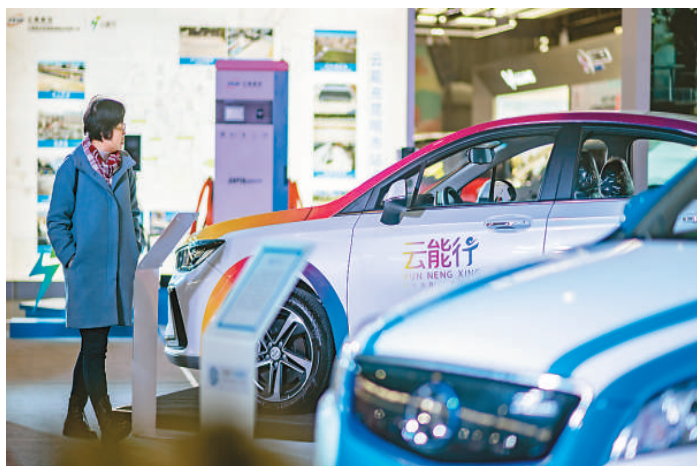
日前,新能源汽车下乡云南站活动启动仪式在昆明国际会展中心举行,来自北汽昆明分公司、东风云汽等企业参加了本次活动。图为前来参加活动的市民在现场参观。