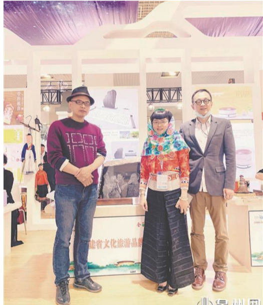
著名藝術家陳文令(左)為泉州工藝美術點贊

“雲端”搭臺，文化築橋。4日至7日，第十三屆海峽兩岸文化產業博覽交易會(下稱“文博會”)在廈門舉行，泉州參展團在本屆文博會上備受矚目，亮點紛呈，收獲滿滿。本屆文博會泉州主打“海絲泉州”品牌，全市97家企業攜手亮相，通過146個展位，展示泉州文化產業和文旅融合新成果，成為最具人氣的展區之一。本屆文博會期間，泉州共簽約22個項目，總金額達140.3億元。