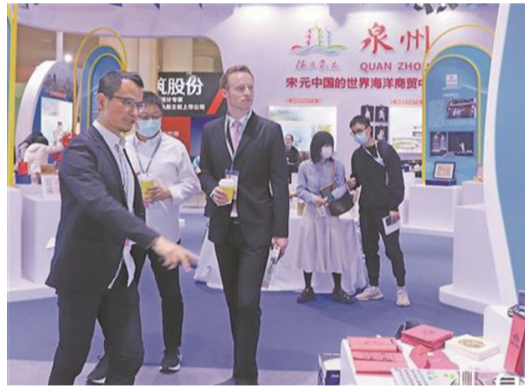
泉州主題館人氣爆棚