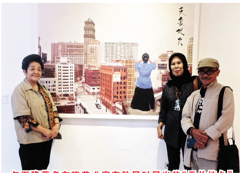
与万隆著名友族艺术家在独展时展出的“天长地久”