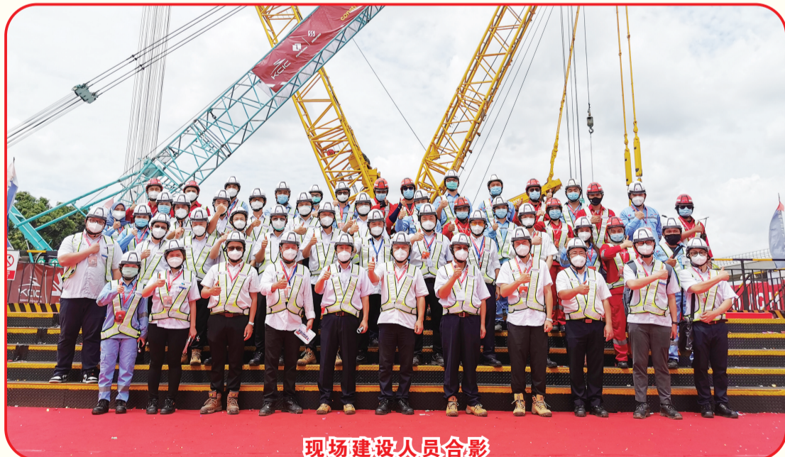
现场建设人员合影