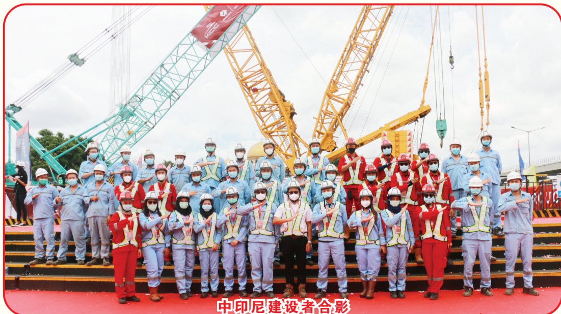
中印尼建设者合影