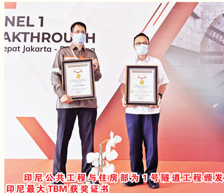
印尼公共工程与住房部为1号隧道工程颁发印尼最大TBM获奖证书