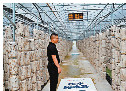
■金米村的智能連棟大棚裏，溫度、濕度和光照等關鍵數值都能實時顯示並傳送給農戶。

他並告訴香港文匯報記者，今年以來，他加大投入種植了10萬袋木耳菌包，生活徹底變了樣。「有智能技術的加持，農活輕鬆了許多，既能照顧家人，收入還比原來增加了兩三