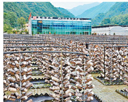
■村民們在塔栽基地裏採摘木耳。