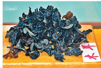
■柞水黑木耳