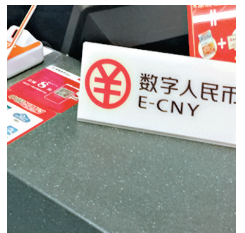
深圳與蘇州相繼試點數字人民幣。 資料圖片

艾瑞諮詢近期公布的中國第三方支付季數據報告顯示，支付寶和財付通分別佔據第三方移動支付55.6%、38.8%的市場份額。