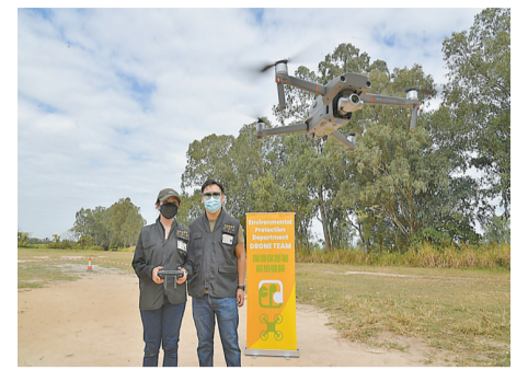
環保署航拍機隊協助部門偵破兩宗非法填土個案。

【香港商報訊】記者周偉立報導：環境保護署成立航拍機隊，以打擊非法填土工程，並在魚群死亡事件中協助追蹤污染源頭，過去一年初見成效。署方期望擴大應用範圍，加強保護環境，例如用於監察堆填區運作、應對海上垃圾等。