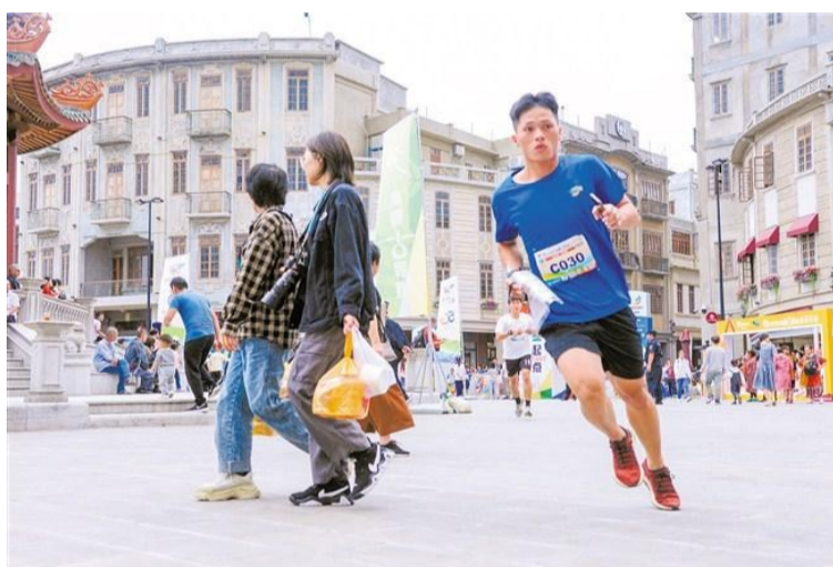
跑過小公園歷史文化街區。

11月22日,2020年南粵古驛道定向大賽(總決賽·汕頭南澳站)跑進汕頭,吸引了各界的關注目光。本次賽事選定在“世界記憶名錄僑批紀念地”西堤公園、“中國唯一呈放射狀格局騎樓街道”汕頭市金平區小公園歷史文化街區,“廣東省唯一的海島縣”“東南沿海通商重要節點”南澳縣舉行,以“古驛道+汕頭歷史文化城區+海島旅游文化”的創新模式,將全民健身活動與發展歷史文化城區旅游、海島旅游、促進鄉村振興融合起來,促使汕頭城區歷史文化與南澳島海島文化通過南粵古驛道定向大賽平臺有機銜接,打造了一場全面展示汕頭開埠文化、海島文化和籌辦第三屆亞洲青年運動會工作成效的文旅體盛宴。