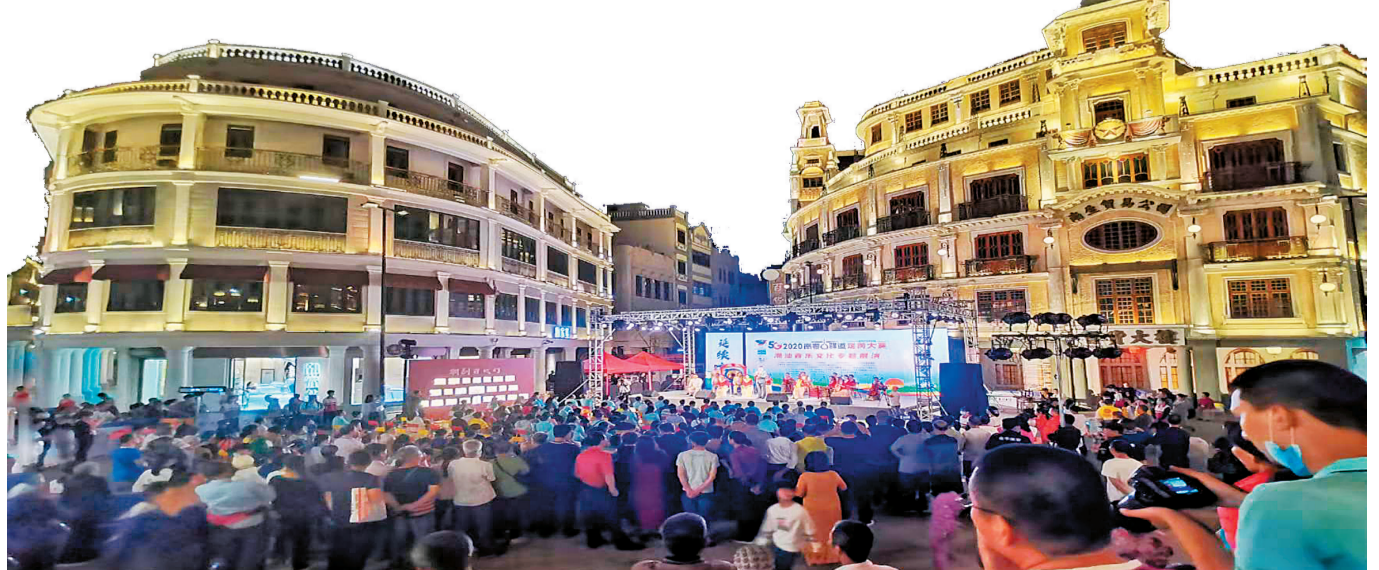
潮汕音樂文化專題展演在小公園開埠區舉行。