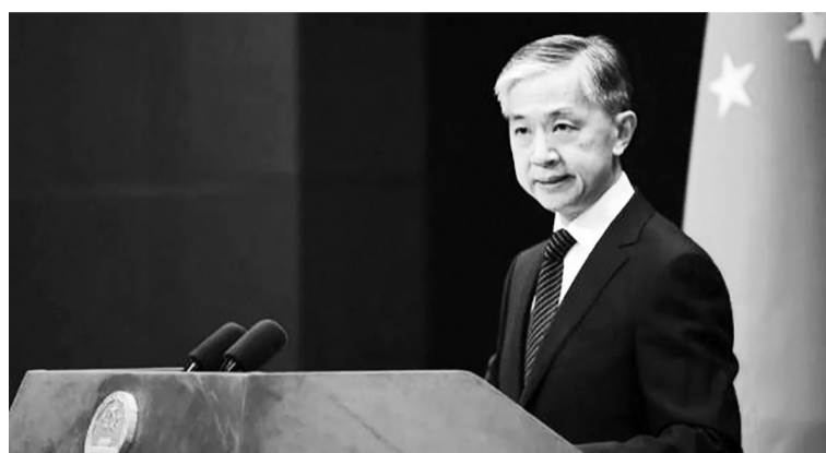
将经贸问题政治化,停止滥用国家力量、泛化国家安全概念、打压外国企业的错误行为。中国政府将继续坚定维护中国企业的正当合法权益。

第二,中方坚决反对美国政府无端打压中国企业,有关行径严重违背美方一贯标榜的市场经济原则和国际经贸规则,必将损害各国投资者的利益,也会损害美国的国家利益和自身的形象。中方敦促美国政府停止