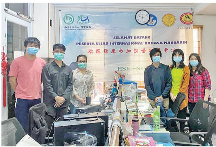
上午考场的工作人员(在师资班)

【本报讯】12月12日上午,2020年印尼西加华文教育协调机构师资培训班举办了汉语水平居家考试。本次考试为西加省的第二次居家考试。考试前