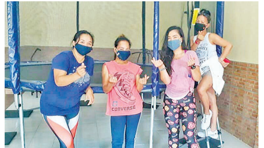
尊巴教练阿优女士和学员们