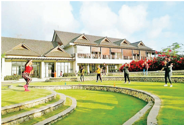
Jimbaran Hub 户外场地的尊巴锻炼