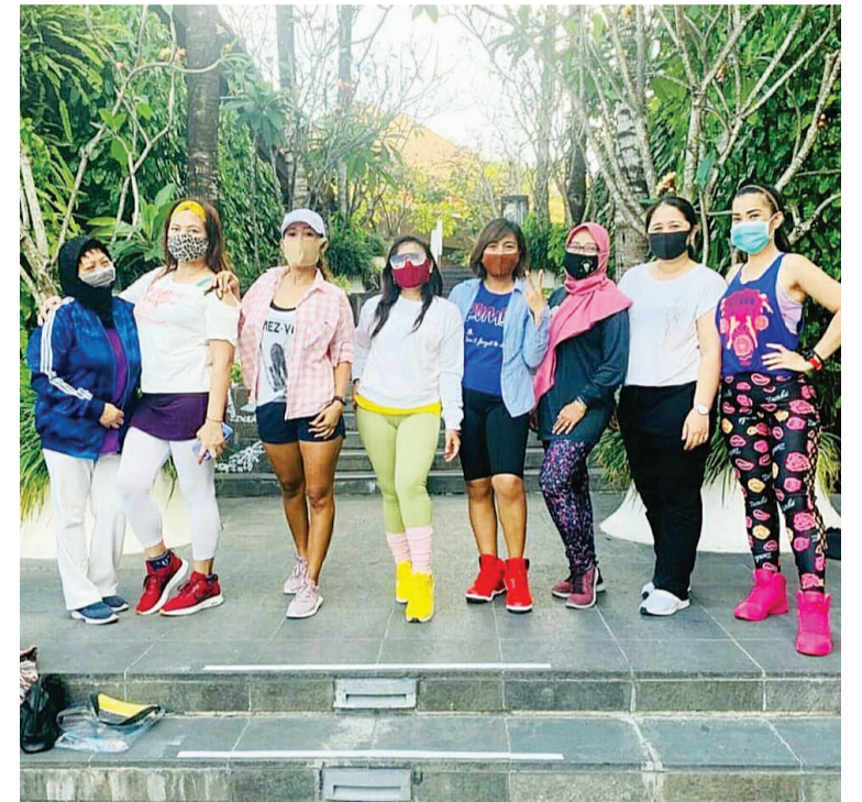
Samasta 商铺空地前的尊巴锻炼