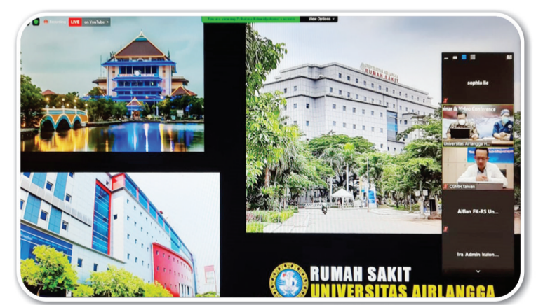
Universitas Airlangga 医院的图片