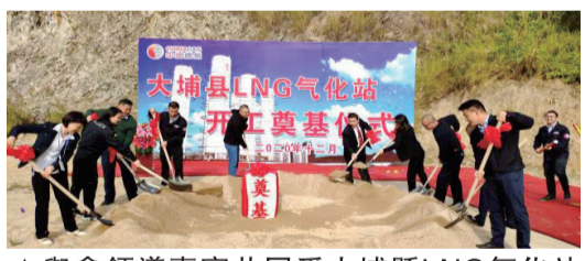
▲與會領導嘉賓共同為大埔縣LNG氣化站培土奠基