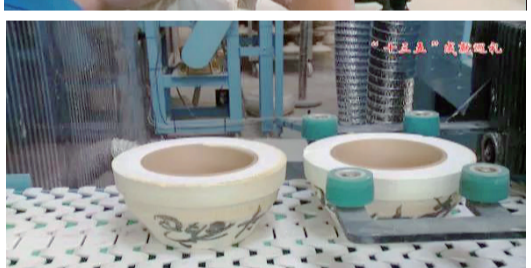
大埔制瓷歷史悠久，文化底蘊深厚，距今已有800多年，在中國的陶瓷文化和

工藝發展史上，占有極其重要的地位。“十三五”時期，大埔縣陶瓷產業基地被認定為國家外貿轉型升級基地，成為梅州市第一個國家級外貿轉型升級基地，陶瓷產業提質升級。