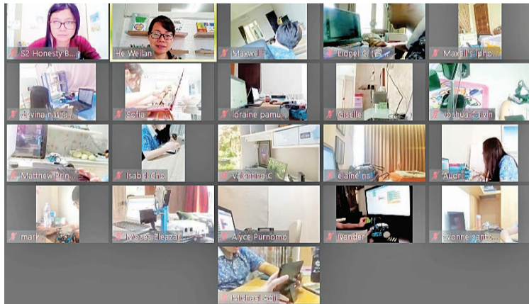
S2-Honesty 的学生们诚信考试