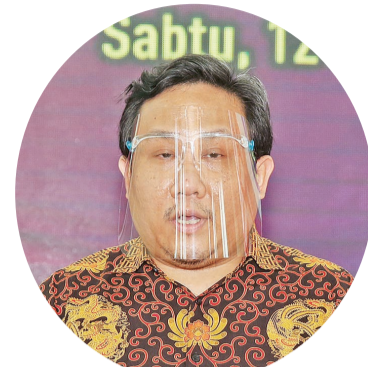
黄高雄报告理监事名单