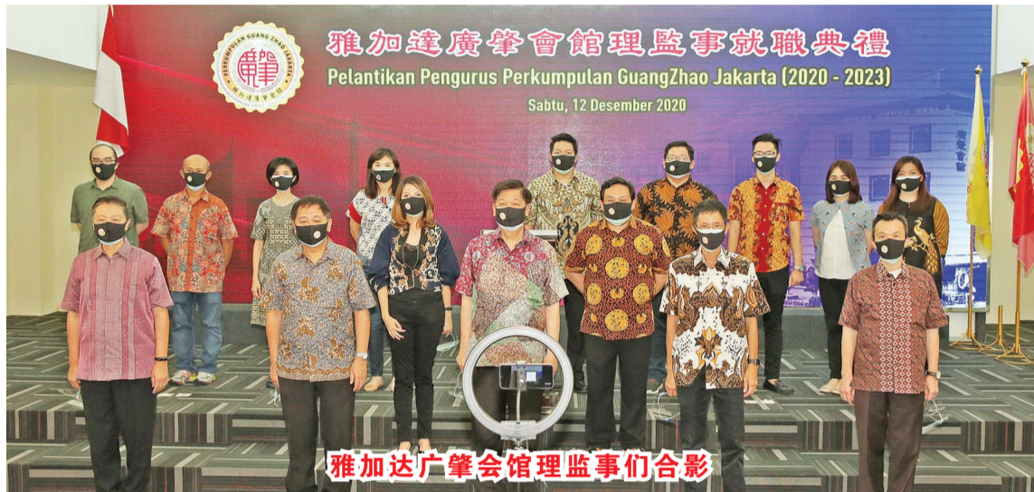
雅加达广肇会馆理监事们合影