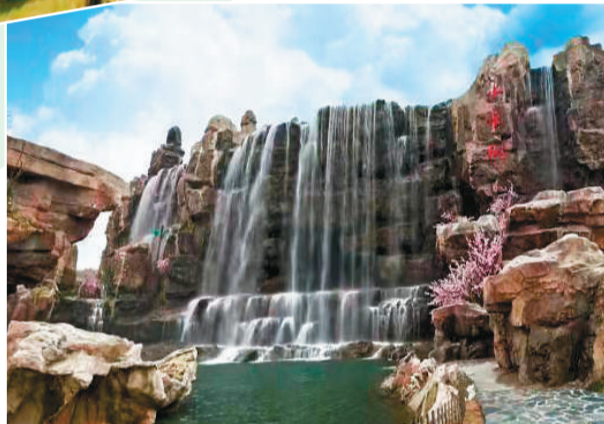
象山影视基地景观