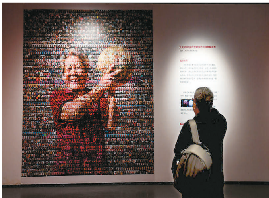
第四届“中国图片大赛”颁奖典礼暨藏品展日前在深圳举行。图为参观者在拍摄获奖作品。

中国戏剧家协会副主席赵东鸣认为，儿童戏剧教育作为一种综合性的教育方式，很好地平衡了教育需求与教育现实两方面。中国儿童文学研究会会长庄正华说：“若干年后，戏剧的作用将慢慢显现，感受过戏剧魅力的孩子们将成为具备审美能力的人，戏剧教育将为全民素质的提升发挥更大作用。”在他看来，感受和学习戏剧对于孩子来说有两方面非常重要：一是释放天性，二是理解人性。戏剧教育就是要充分释放孩子的天性，让孩子走进角色内心，设身处地去思考角色的每一句话和每个选择。