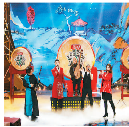
《国乐大典》第三季节目现场