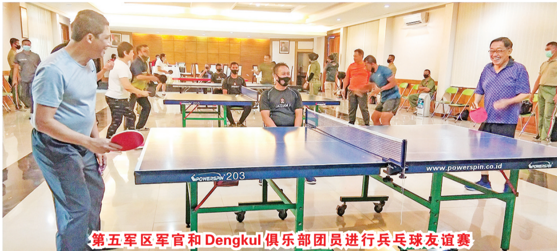
第五军区军官和Dengkul俱乐部团员进行乒乓球友谊赛