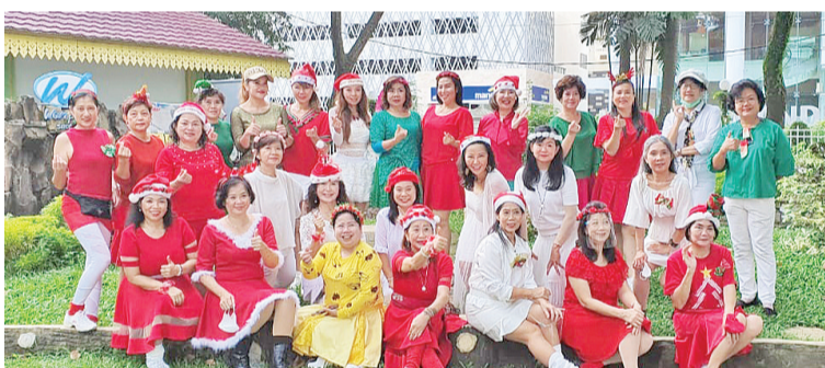
全体队友与教练合照