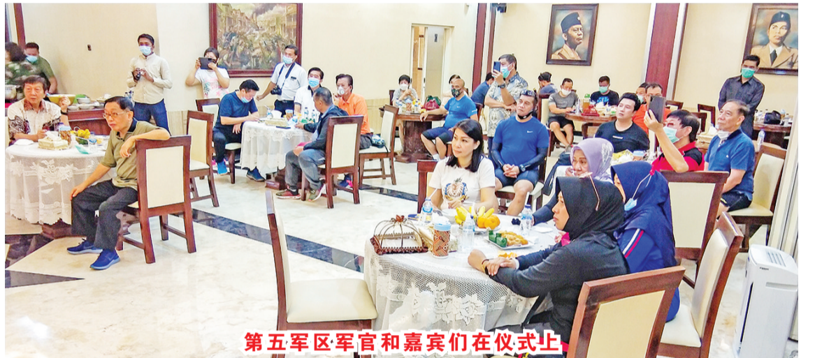
第五军区军官和嘉宾们在仪式上