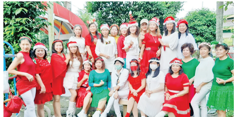
全体队友与教练合照