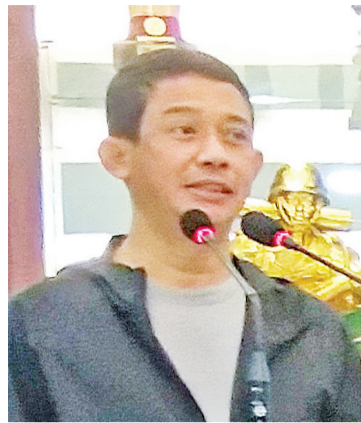
苏哈延多少将致词