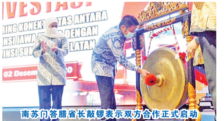
南苏门答腊省长敲锣表示双方合作正式启动