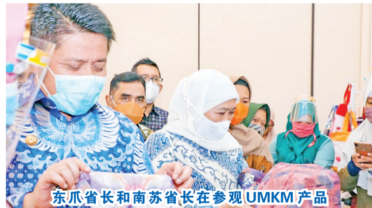
东爪省长和南苏省长在参观UMKM产品

会上,东爪省长科菲法女士表示,希望两省共同建立的贸易团和共同发展的合作关系,能激励各自省的贸易与建设。