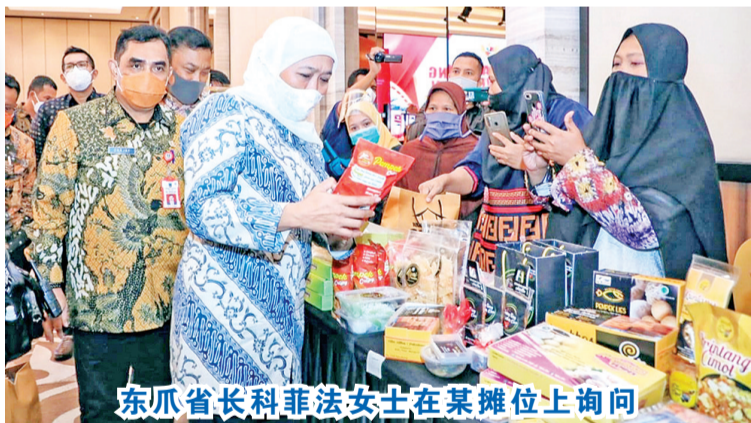
东爪省长科菲法女士在某摊位上询问