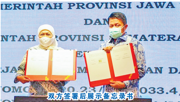
双方签署后展示备忘录