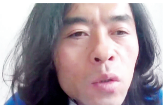
西北民族大学主讲人