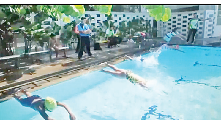
学生们畅游于洁净的游泳池