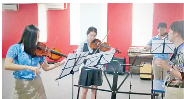
小提琴手们拉出了悠扬的音乐