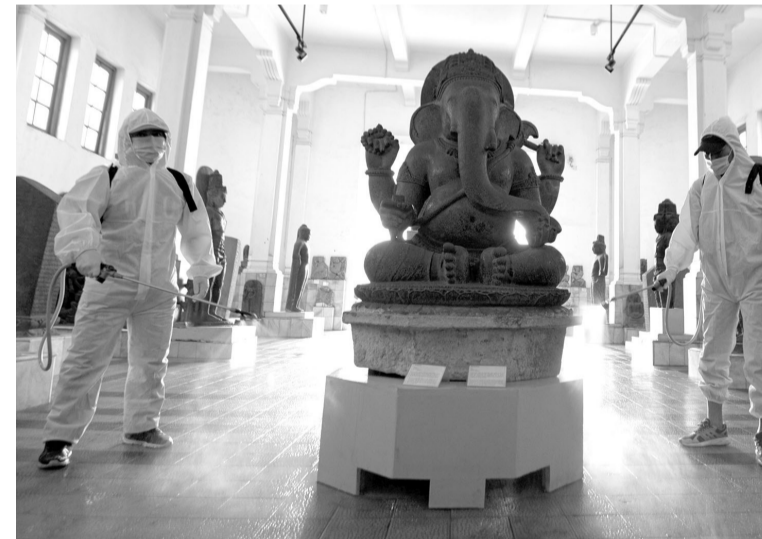
在国家博物馆喷洒消毒液 为保护游客的安全,印尼红十字会(PMI)人员在雅加达国家博物馆喷洒消毒液。

政府希望通过经济转型,能为大中小企业提供营商方便,同时希望在2021年,除了投资方面能大幅增加之外,经济方面也恢复正常发展。(Sm)