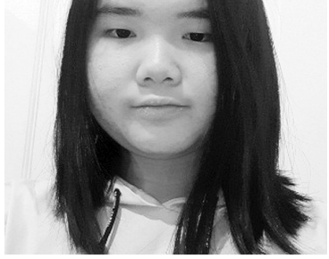
因为有新冠病毒的流行,我们不能如常到学校

上课了,所以只能在网上学习。从星期一、星期三及星期五,我七点开始在网上学习,下午一点三刻才结束。星期四,我下午一点零五分结束了。每门课的课时是四十分,也有两次十五分的课间餐。