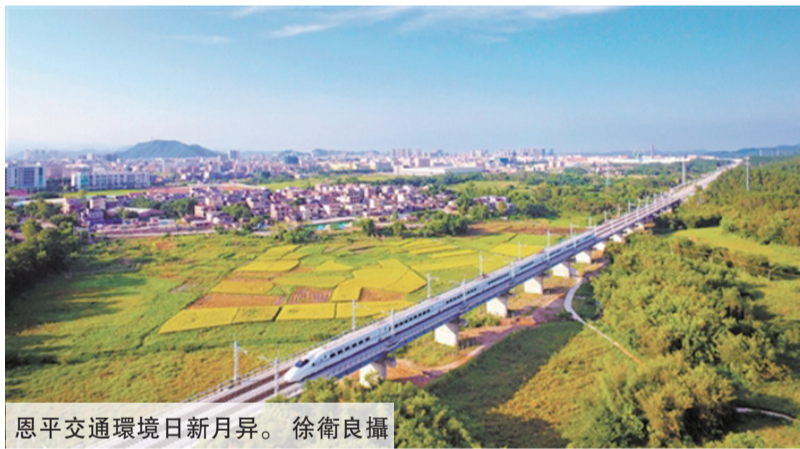
恩平交通環境日新月異。

2020恩平投資推介會日前舉行。本次推介會以“新產業 啟協同 強制造”為主題，力求對接大型央企、知名民企、行業龍頭企業，聚焦重點產業、重點領域實施精準招商，為江門市加快打造珠江西岸新增長極和沿海經濟帶上的江海門戶作出新的更大貢獻。