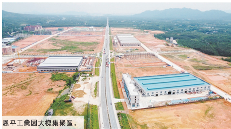
恩平工業園大槐集聚區。