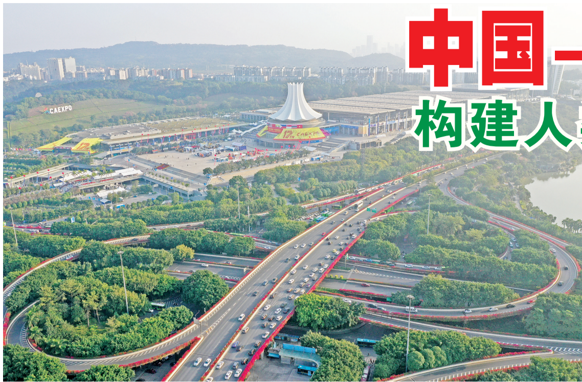
这是南宁国际会展中心及周边建筑。11月30日，为期4天的第17届中国—东盟博览会、中国—东盟商务与投资峰会在广西南宁闭幕。