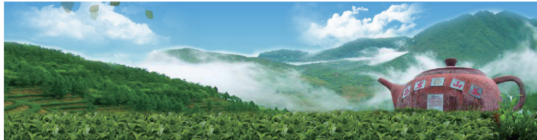
▲西岩茶葉集團茶場

傳承發展，不斷耕耘。近年來，大埔縣高度重視茶葉產業發展，把發展茶葉產業作為本地農民耕山致富的主攻方向之一，以推進現代農業產業園建設、打造三產融合示範區等一系列強有力措施，做強做大做優茶葉產業，創品牌提檔次增產。