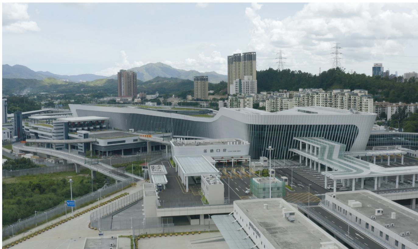
8月26日，深圳新口岸莲塘/香园围口岸启用。

俯瞰珠江口，港珠澳大桥长虹卧波，连接粤港澳三地。南沙大桥建成通车，又添一过江通道。深中通道、黄茅海跨海通道建设正不断加快。四通八达的交通基础设施，将大湾区“1小时生活圈”越织越密。 自2017年7月1日，习近平总书记 记亲自见证《深化粤港澳合作 推进大湾区建设框架协议》签署以来，广东坚持“中央要求、湾区所向、港澳所需、广东所能”，以粤港澳大湾区建设为“纲”，举全省之力推动各项工作，携手港澳推动大湾区建设迈出坚实步伐。