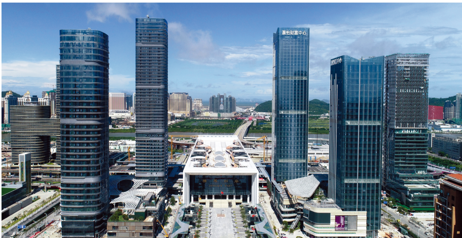
8月18日，珠海横琴口岸新旅检区域启用。