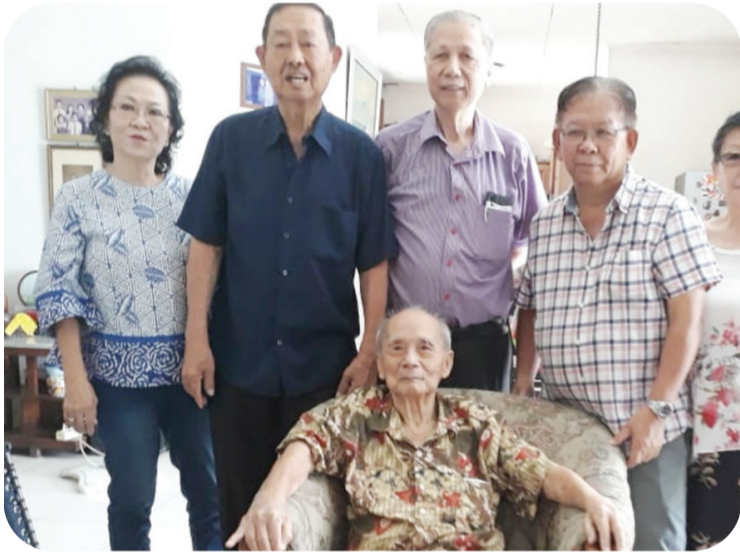
昔日照片,挚友探望陈老师