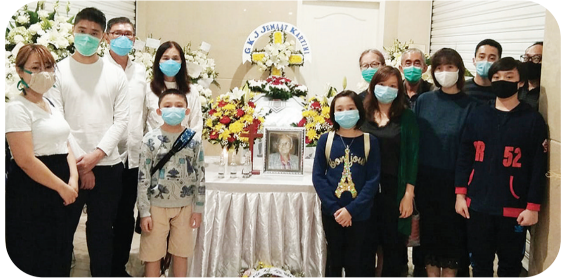
陈府家属在灵堂前合影